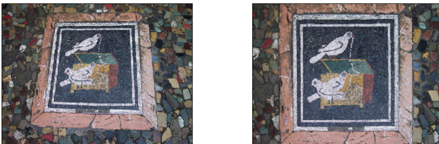
FIGURE 1 – Changement de perspective sur un plan par homographie

Q2 : À partir du code fourni, essayez d'estimer l'homographie permettant de transformer l'image de la mosaïque Pompei.jpg en vue verticale (en supposant le cadre carré, voir Figure 1). Pour cela, cliquez dans l'image (bouton de gauche) les points que vous voulez sélectionner, puis entrez pour chaque point les nouvelles coordonnées voulues (un clic avec le bouton de droite remet les points à zéro et la touche "q" indique que vous avez sélectionné assez de points). Combien de points au minimum devez-vous sélectionner ?